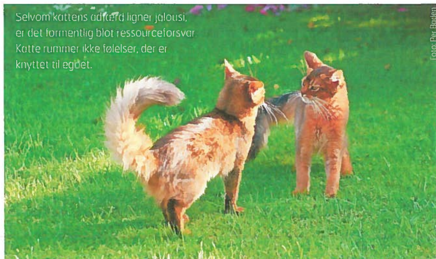
Selvom kattens adfærd ligner jalousi, er det formentlig blot ressourceforsvar. Katte rummer ikke følelser, der er knyttet til egoet.